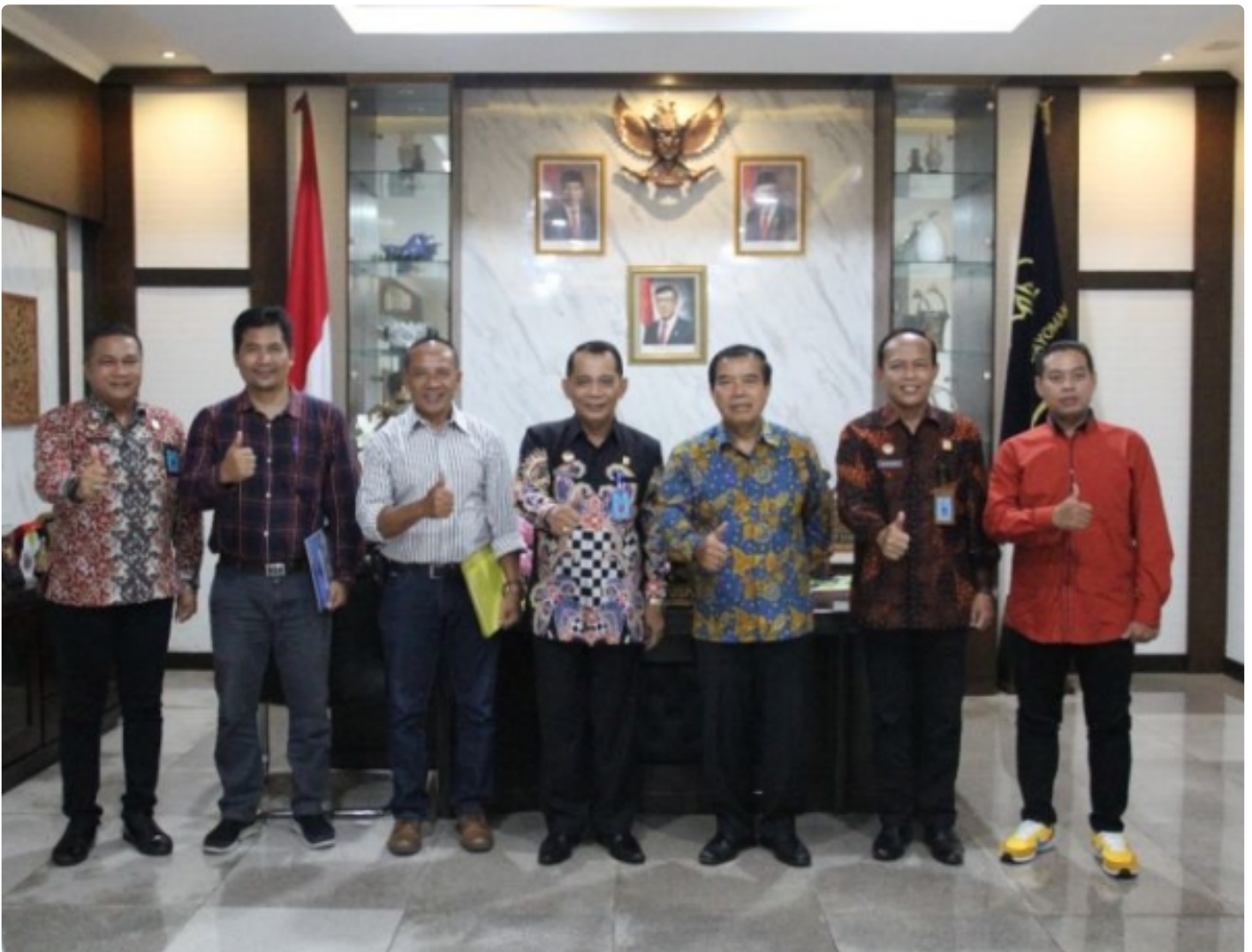
Kemenkumham Jateng - Unimus Jajaki Kerja Sama Bagi Perguruan Tinggi Muhammadiyah dan Aisyiyah

SEMARANG - Sinergitas dan kolaborasi antara Kantor Wilayah Kementerian Hukum dan HAM Jawa Tengah dengan Universitas Muhammadiyah Semarang (Unimus) semakin ditingkatkan.